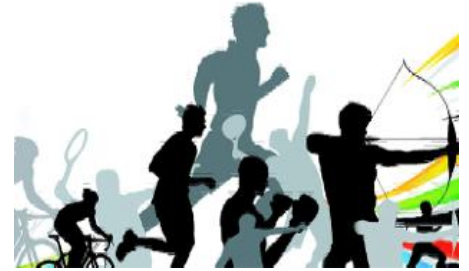
The Sports Ministry has roped in Oriental Insurance Company Limited as its insurance partner under the Target Olympic Podium scheme for athletes.