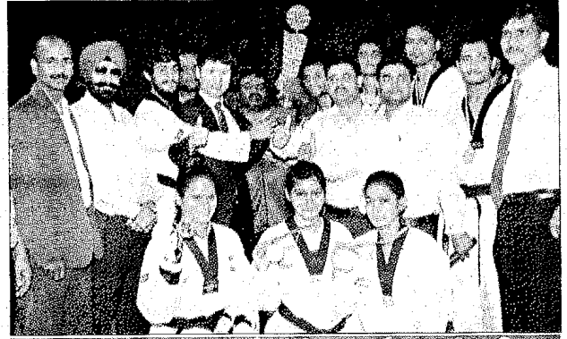
पंजाब केसरी ने निर्माई मीडिया पार्टनर की भूमिका

सभी टीमों को भी ट्रॉफी व मेडल से सम्मानित किया गया। इस लीग में देशभर से ताइक्वांडो खिलाड़ियों ने हिस्सा लिया। लीग में 9 टीमों ने भाग लिया जिनमें 81 खिलाड़ी थे। लीग में दिल्ली योद्धा की टीम सबसे युवा टीम रही। जबकि अन्य टीमों के लगभग सभी खिलाड़ी अंतर्राष्ट्रीय स्तर के खिलाड़ी थे। बावजूद इसके दिल्ली योद्धा की टीम ने पूरे लीग में अपने खेल से सभी को अचंभित