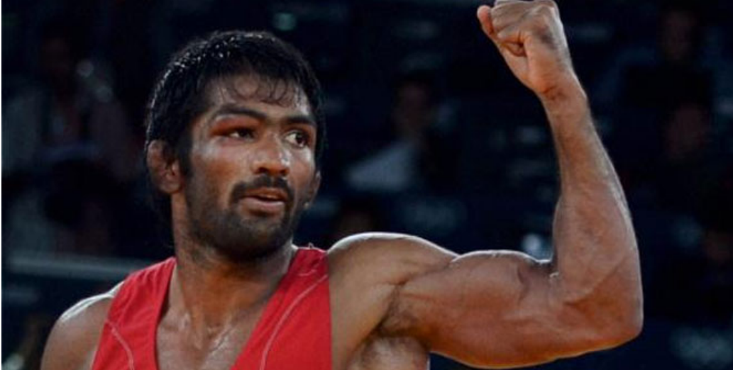
Indian wrestler Yogeshwar Dutt

New Delhi: The Sports Ministry has roped in Oriental Insurance Company Limited as its insurance partner under the Target Olympic Podium (TOP) scheme for athletes.